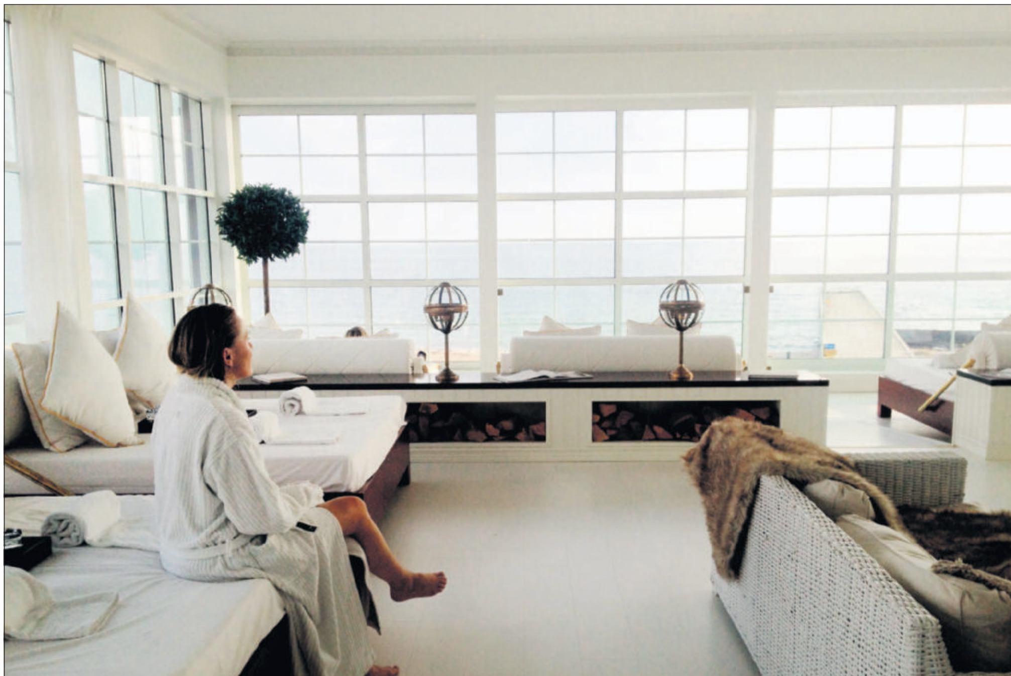
Ystad Saltsjöbadets helt store force er udsigten, som jo er gratis, når først man er gæst på hotellet. I det nyåbnede Spa Seaview kan man dejsse om på en af de hvide brikse og lade lyset synke ind.