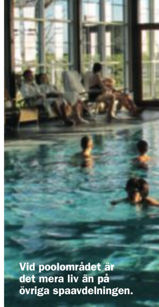
Vid poolområdet är det mera liv än på övriga spaavdelningen.