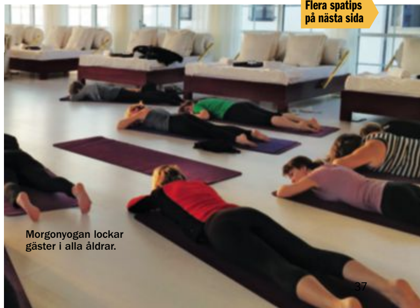
Morgonyogan lockar gäster i alla åldrar.