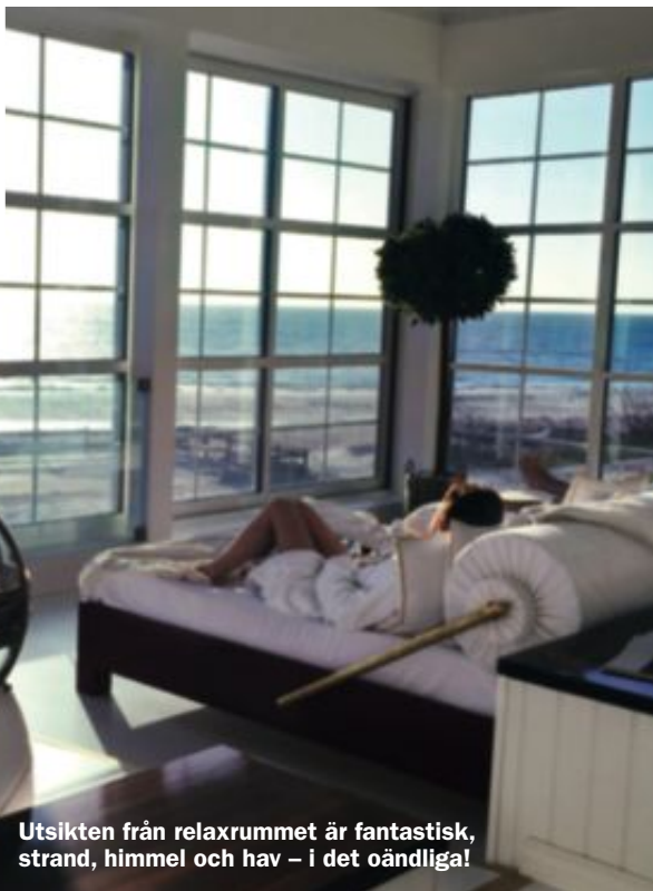
Utsikten från relaxrummet är fantastisk, strand, himmel och hav – i det oändliga!